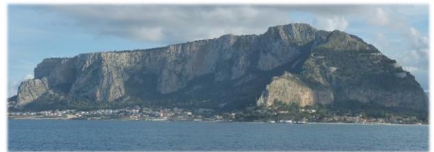
Blick vom Hotel Splendid La Torre auf den Monte Pellegrino

Wir wohnen in dem Seebad Mondello vor den Toren Palermos und genießen den Ausblick auf den Monte Pellegrino.