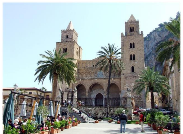
Cefalù - Dom

Es geht entlang der Nordküste. Cefalù sollte die Grablage der Normannenkönige werden. Hier bestaunen wir den herrlichen Mosaikzyklus im Dom. In Himera, wo die Griechen die Karthager besiegten, besuchen wir die Reste des dorischen Siegestempels.