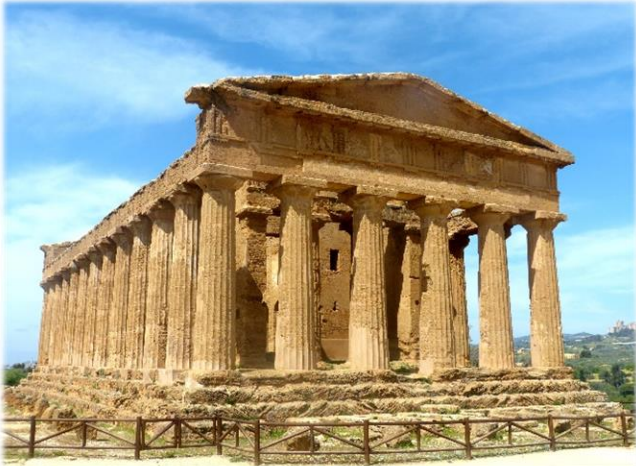
Agrigent – Tempel der Concordia.

Natürlich beschäftigen uns hier auch der Philosoph Empedokles, der Hymnendichter Pindar und der Dramatiker Pirandello, die alle dieser Stadt entstammen.