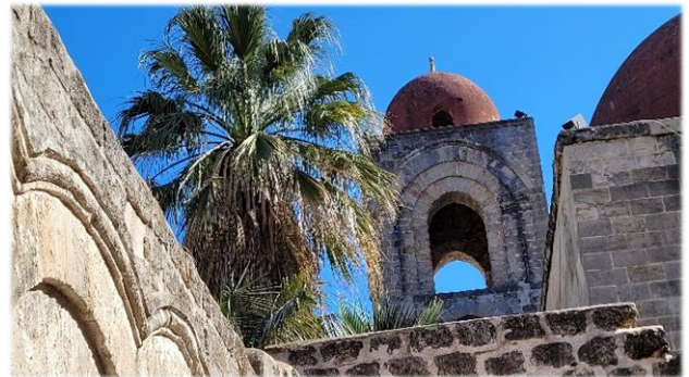
San Giovanni degli Eremiti – Moschee oder Kirche?

Unser Stadtrundgang führt uns zum Palazzo dei Normanni, dessen Hofkapelle unter König Roger II. im normannisch-arabisch-byzantinischen Stil errichtet wurde.