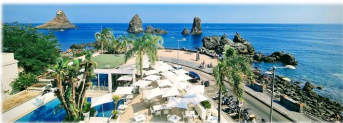
Terrasse des Hotels Faraglioni

Übernachtung und Abendessen im Hotel Faraglioni**** in Acitrezza.