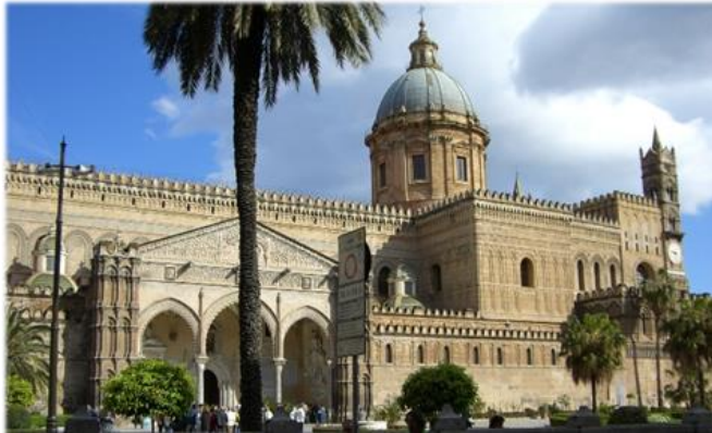
Der Dom von Palermo

Palermo. Der Platz wird auch Teatro del Sole genannt, weil den ganzen Tag über das Sonnenlicht auf eine der Eckfassaden fällt.