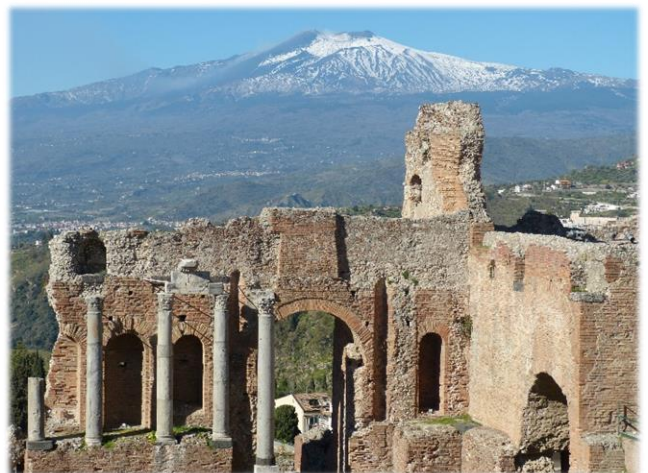
Blick vom griechischen Theater auf den Ätna.

Danach erkunden wir die malerische Altstadt von Taormina mit dem römisch – griechischen Theater. Wenn gutes Wetter ist, bietet sich uns derselbe Blick wie Goethe: Nun sieht man den ganzen langen Gebirgsrücken des Ätna hin, links das Meerufer bis nach Catania , ja Syrakus; dann schließt der ungeheure, dampfende Feuerberg das weite breite Bild, aber nicht schrecklich, denn die mildernde Atmosphäre zeigt ihn entfernter und sanfter als er ist.