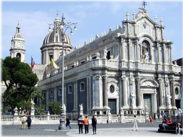
Der Dom von Catania