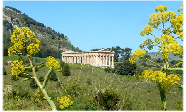
Der Tempel von Segesta

Auf dem Weg nach Mozia begleiten uns Salinen; die Windmühlen erinnern daran, wie einst das Meerwasser in die Becken gepumpt wurde.